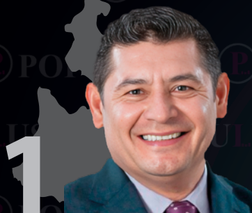
1 Alejandro Armenta PUEBLA 73.8%

(A los entrevistados se les mencionó el nombre de cada gobernador@)