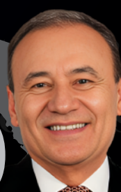
10 Alfonso Durazo SONORA 66.7%