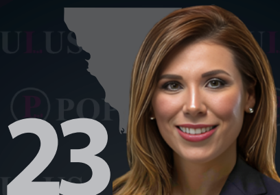
morena Marina del Pilar Ávila BAJA CALIFORNIA 42.8%