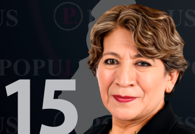
15 Delfina Gómez EDOMEX 54.5%